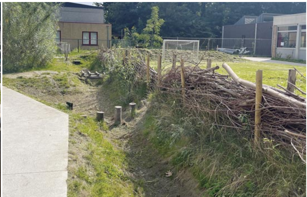
Speelplaats De Zandloper | Sint-Gillis-Waas

de impact van hitte en droogte. Met deze problematieken in het achterhoofd, is de woonwijk omgevormd tot een groene oase met veel infiltratiemogelijkheden en boomschaduw. Het project transformeert een grijze buurt naar een biodiverse, groene ontmoetingsplaats. Bij de aanleg van het park is de verhardingsgraad zo laag mogelijk gehouden en waar mogelijk is bestaande verharding verwijderd.