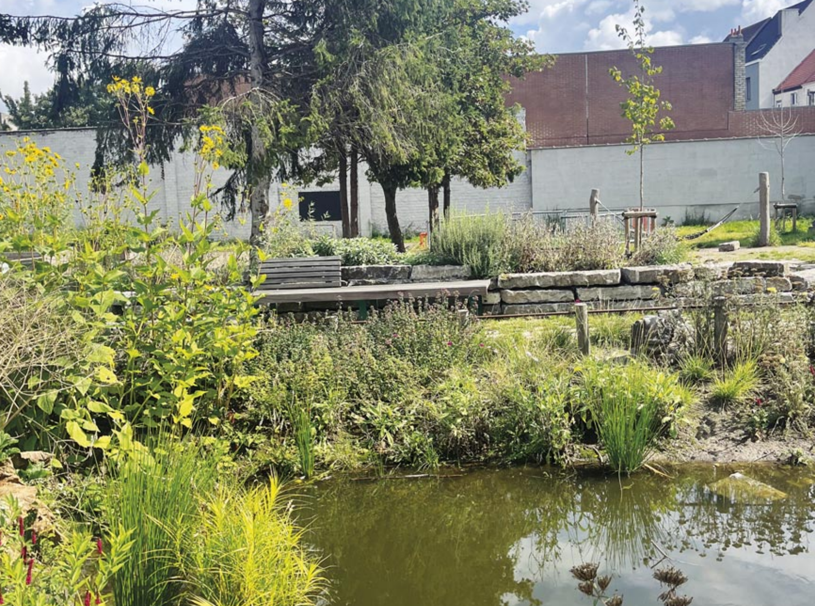
Herman Pillaertpark, Gent