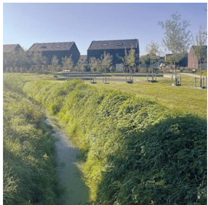
Park Maaïke Kerrebroeck | Brugge