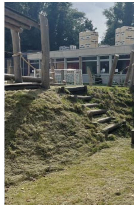
Speelplaats De Zandloper | Sint-Gillis-Waas

De speelplaats, waarvan het hemelwater afwaterde naar de riolering, is nu maximaal onthard. Zes wadi's met een volume van 94 m 3 bufferen regenwater. Zo stroomt het water niet meer af, maar kan het infiltreren in de bodem. Deze ingrepen beschermen tegen wateroverlast en droogte. De nieuwe multifunctionele ruimtes zijn groen ingericht en moedigen aan tot actief buitenspelen. Naast een wilgentunnel zijn ook vijf nieuwe streek-eigen bomen aangeplant. Deze bomen zorgen voor schaduw op de speelplaats en beschermen tegen hittestress. Minder vitale bomen zijn gerooid voor de veilig-