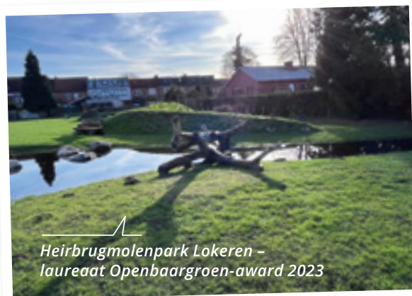
Heirbrugmolenpark Lokeren - laureaat Openbaargroen-award 2023