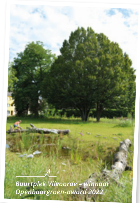
Buurtplek Vilvoorde – winnaar Openbaargroen-award 2022

"Het is zalig om bruggen te bouwen tussen de natuur, aannemers, bewoners, ..."